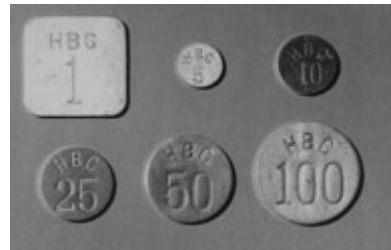
Des jetons en aluminium de la CBH pour la traite du renard arctique servirent de 1946 à 1961. HBCA 1987/363-M-39/1

Ces jetons étaient ronds. Ils étaient en aluminium et furent émis en cinq valeurs : 5, 10, 25, 50 et 100 cents. Ils mesuraient respectivement 20 mm, 26 mm, 32 mm, 39 mm et 46 mm. Le sixième jeton, celui qui valait une peau de renard arctique, était carré. Il était frappé du chiffre « 1 » et mesurait 46 mm. Tous les jetons étaient frappés de leur valeur et des lettres HBC d'un côté. L'autre côté ne portait aucun signe ou inscription.