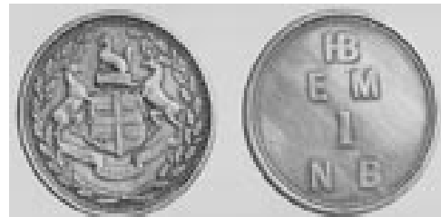
Jetons en laiton de 1 plue émis par la CBH. HBCA 1987/363-M-39/5

Les jetons étaient en laiton. Ils étaient frappés des lettres HB (Hudson's Bay Company), EM (East Main District) et MB (Made Beaver) et mentionnaient la valeur du jeton. En fait, au lieu des lettres MB, les jetons portaient les lettres NB par suite d'un défaut de fabrication de l'emporte-pièce. Le jeton portait au verso le blason de la CBH. Au total, quatre pièces furent produites : 1 plue (30 mm), ½ plue (27 mm), ¼ de plue (25 mm) et 1/8 de plue (19 mm).