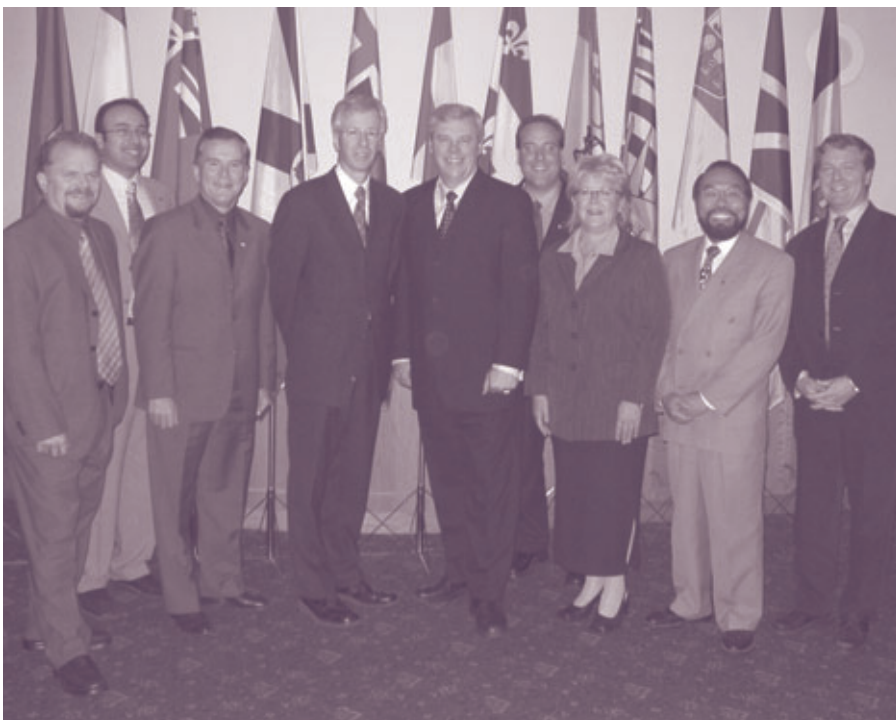
Conférence ministérielle sur les affaires francophones, Winnipeg (Manitoba), les 18 et 19 septembre 2003

Les ministres et députés ont également profité de l'occasion pour rencontrer les représentants de la Société santé en français et du Consortium national de formation en santé pour faire le point sur les importants développements survenus dans ce dossier au cours de la dernière année. Cette rencontre s'inscrivait dans le cadre des démarches déjà entreprises par la CMAF afin de contribuer à l'amélioration des services de santé en français dans les provinces et territoires.