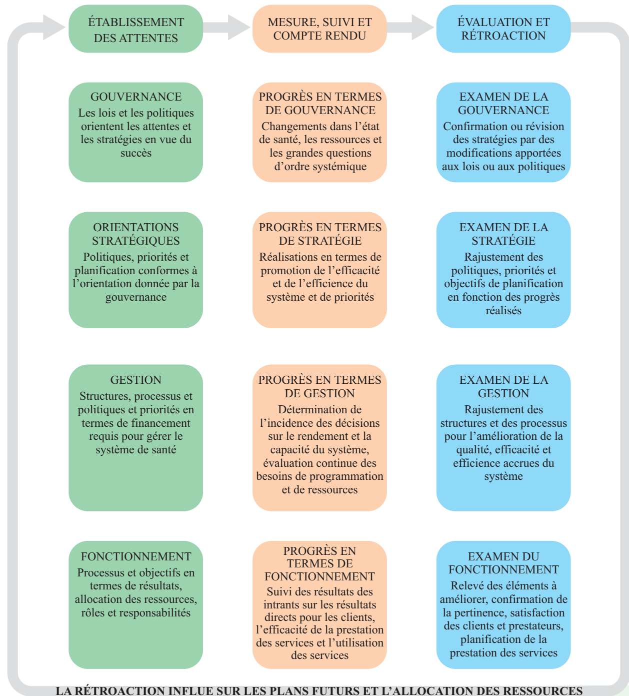
Figure 2 CADRE DE RESPONSABILISATION DU SYSTÈME DE SANTÉ DU MANITOBA

À partir du modèle de responsabilisation, diverses activités ont lieu à l'intérieur de chacun des éléments décrits dans le cadre de responsabilisation ci-dessous.