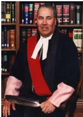
Monsieur le juge Murray Sinclair

Le juge Murray Sinclair sera le conférencier principal de la conférence de l'ACCCDP 2003 (Association canadienne des Commissions et Conseil des droits de la personne), qui aura lieu à Winnipeg ce mois-ci.