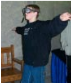
Parents et enfants ont participé à l'expérience virtuelle sur les effets de l'alcool, organisée à l'un des nombreux stands interactifs de la Journée du droit.