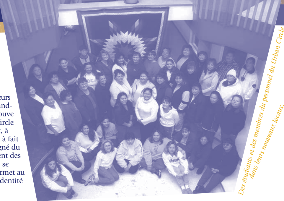
Des étudiants et des membres du personnel du Urban Circle dans leurs nouveaux locaux.

Voici d'autres mesures prises par le Ministère conjointement avec les centres d'apprentissage pour adultes :