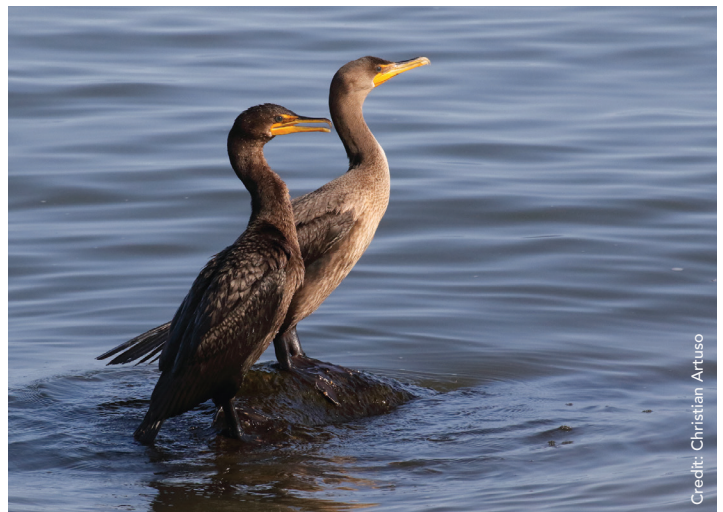
Cormorans à aigrettes

La Loi sur les parcs provinciaux précise que les parcs provinciaux sont destinés aux Manitobains. Les parcs provinciaux sont reconnus en tant qu'endroits spéciaux qui jouent un rôle important dans la protection des terres naturelles et dans la qualité de vie des habitants du Manitoba. Le droit d'accès des Autochtones à cette zone pour la chasse, le piégeage, la pêche et les autres occupations traditionnelles sera toujours respecté.