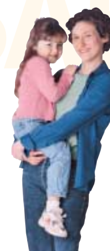
Parent avec un enfant Revenu : 20 000 $