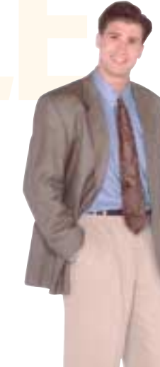
Personne célibataire Revenu : 35 000 $