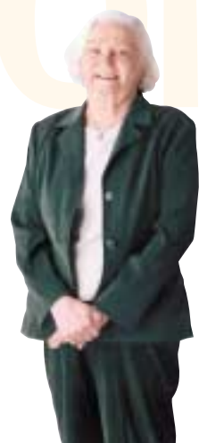
Personne âgée seule Revenu : 20 000 $