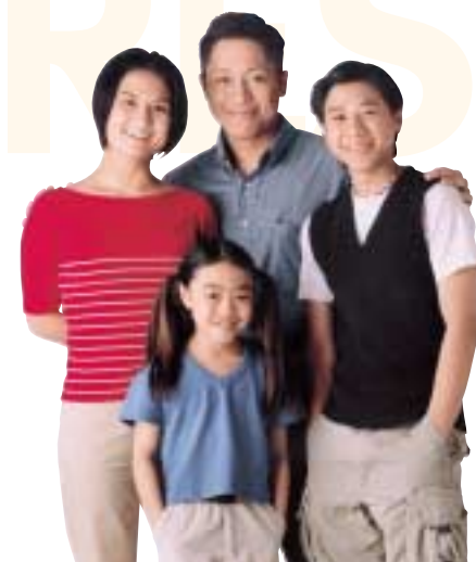
Famille de 4, un salaire Revenu : 40 000 $