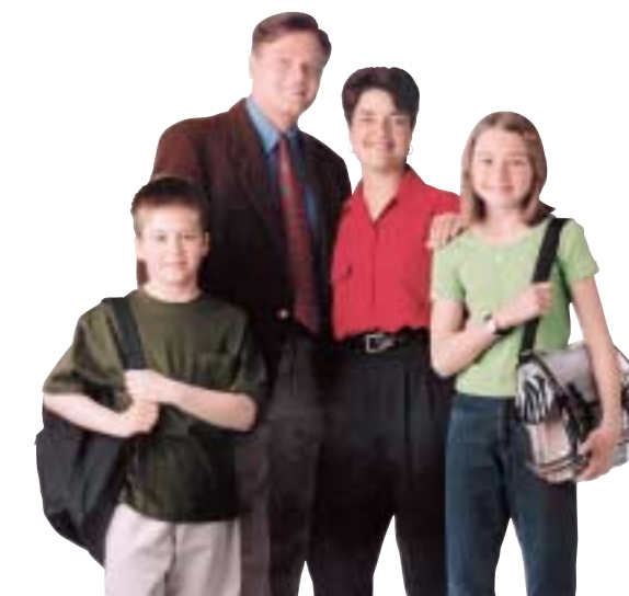
Famille de 4, deux salaires Revenu : 60 000 $