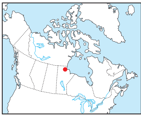
Location Map - Carte de Localisation

L'acquisition, la compilation des données ainsi que la production des cartes furent effectuées par Sander Geophysics Limited, Ottawa, Ontario. La gestion et la supervision du projet furent effectuées par la Commission géologique du Canada, Ottawa, Ontario.