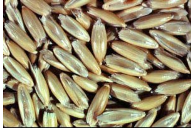
Oats Seed

马尼托巴出口未加工的燕麦及各种燕麦产成品。在过去的几年中，未加工的燕麦出口量下降，而成品燕麦的出口上升。未加工燕麦长期以来被广泛用于赛马饲料，近来美国将燕麦用于制粉及谷物产品。马尼托巴向世界出口燕麦糠、燕麦片及燕麦面粉。我们的大部分燕麦及产成品出口到美国，其它燕麦出口国包括日本、中东几个国家及哥伦比亚、智利以及拉丁美洲和南美洲的几个国家。马尼托巴生产商有着悠久的历史生产高品质燕麦及成品的历史。若您想进一步了解有关马尼托巴燕麦的情况，下面是与本行业有关的几个联系方式。